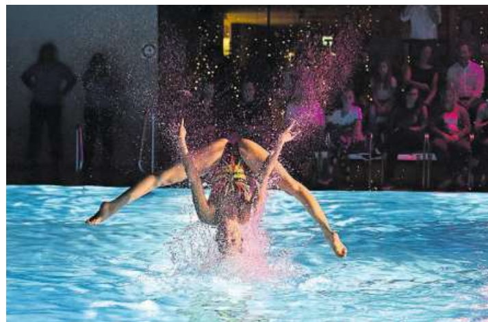
Artistik-Schwimmen auf höchstem Niveau.