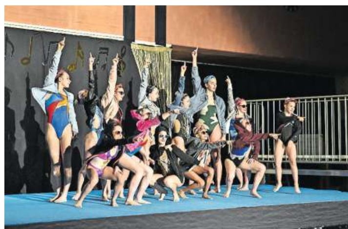
«Let's dance» – eine mitreissende Show des SC Flös.