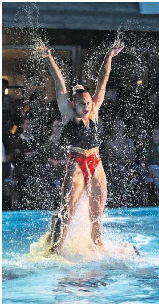
Die Schwimmerinnen boten Spitzenleistungen.