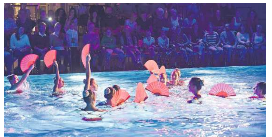
Die Fächer im Gegenlicht, wunderbar eingebaut in die Choreografie.