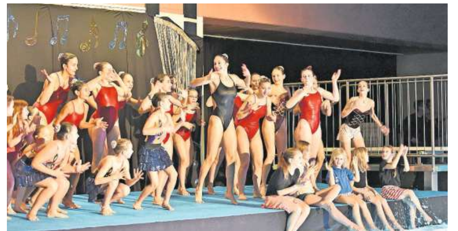
Tänzerisches Talent zeigten die Schwimmerinnen am Beckenrand.