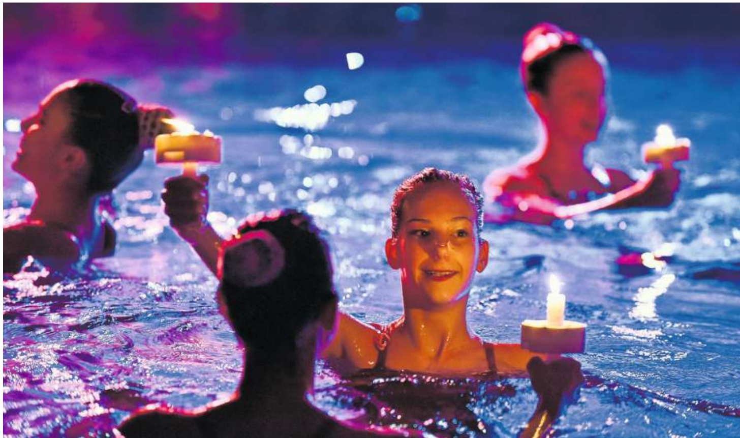
Bei dieser wunderschönen Darbietung kam vorweihnachtliche Stimmung im Hallenbad Flös auf.